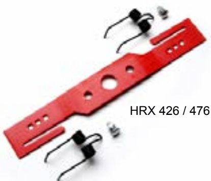
HRX 426 / 476

Andere modellen in voorbereiding / op aanvraag Wijzigingen voorbehouden. Stand: 03-2011